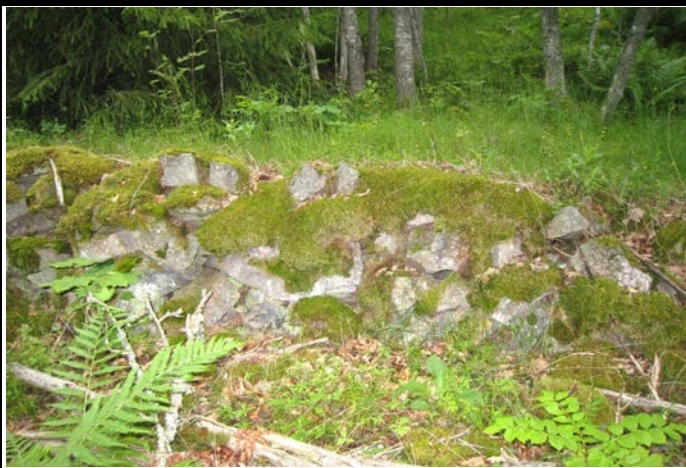
Fotografier - H :