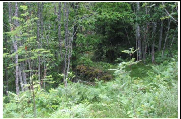
Fotografier - G :