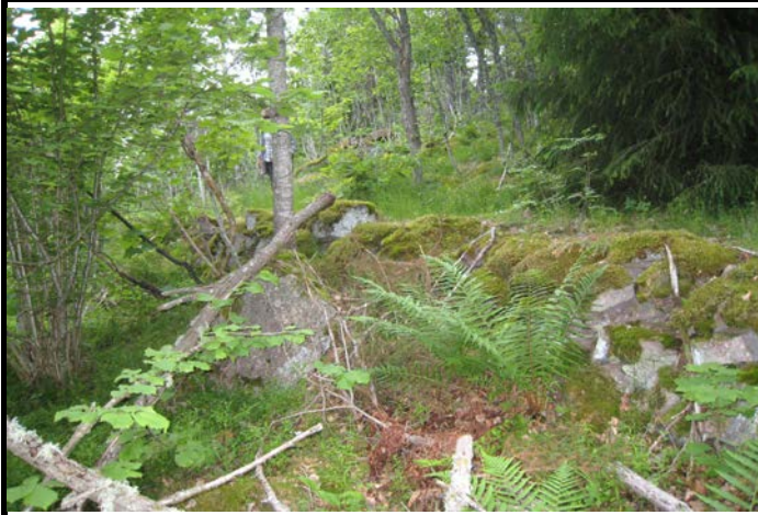
Fotografier - F :