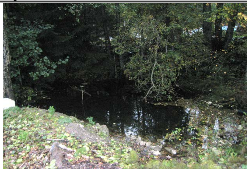
Fotografier - A :